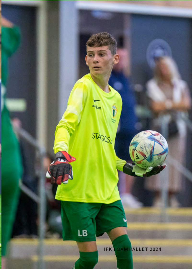
BILDER: DAVID GUSTAFSSON